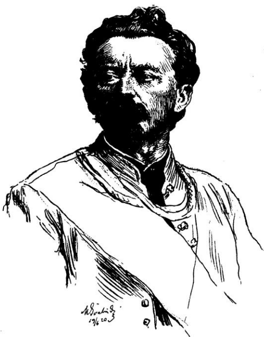
Mir. Tyrš: Jen neúnavná činnost nás spasí, jen opravdová práce nás uchrání a zvelebí.