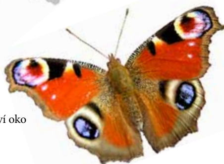
Babočka paví oko